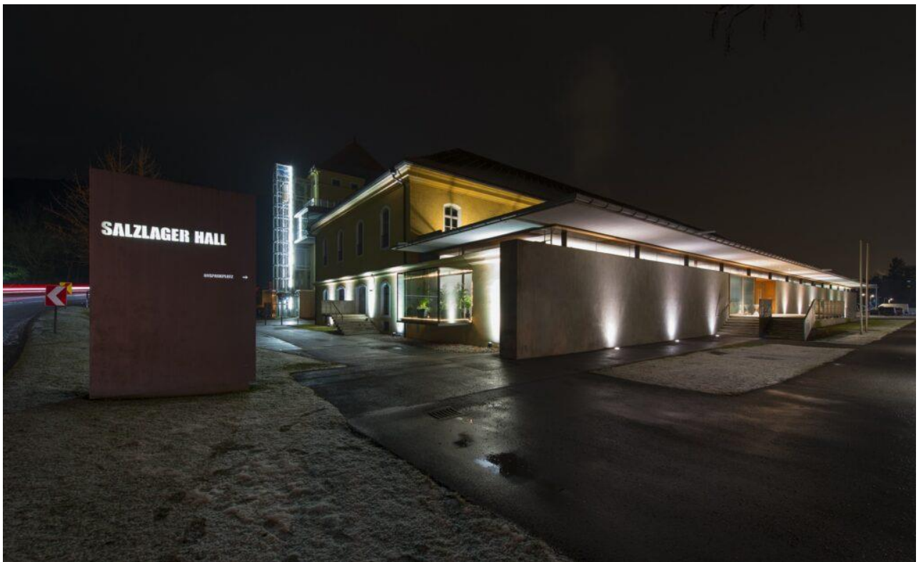
Best Event-Location 2020 beim Austrian Event Award: Das Salzlager.

Die SALZRAUM.Hall livelocations der Hall AG bestehen aus Burg Hasegg/Münze Hall , dem Salzlager und dem Kurhaus Hall . Mit ihren Ursprüngen im 13. Jahrhundert ist die Burg Hasegg eine der ältesten Begegnungsstätten Österreichs. Im 15. und 16. Jahrhundert wurde sie von Kaiser Maximilian I. geprägt. Das Salzlager diente im 19. Jahrhundert als Umschlagplatz für das in der Saline gewonnene „weiße Gold“. Anfang des 20. Jahrhunderts kam im damaligen Solbad Hall das Kurhaus hinzu. Nach Adaptierungsarbeiten Ende des 20. Jahrhunderts wurden die drei historischen Gebäude unter dem Motto „Raum für Geschichte(n)“ zu Veranstaltungszentren umgewandelt.